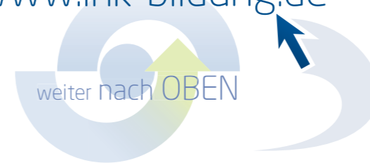
Fotos:innenwestendf.de | aufens stockphoto.com und istockphoto.com (Tief)